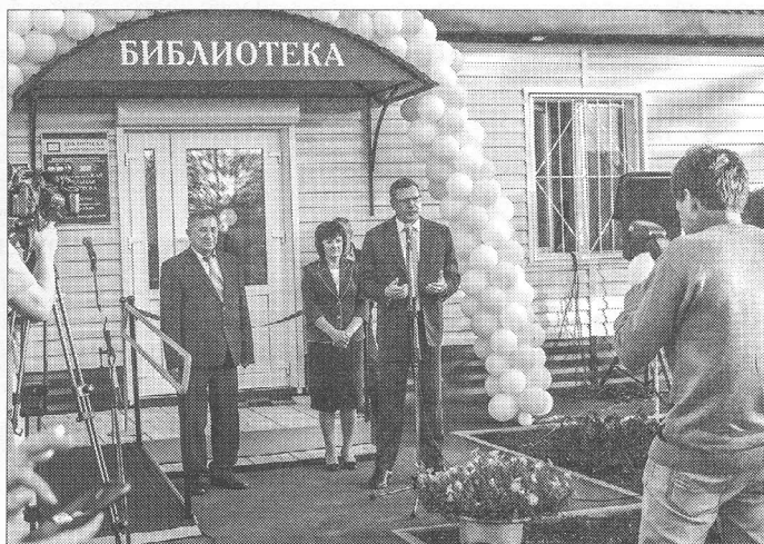
Выступление губернатора Омской области А.Л. БУРКОВА на открытии Новоуральской модельной библиотеки

Столкнувшись с непредвиденными проблемами в ходе ремонта, который изначально не вызывал никаких опасений, специалисты Таврической центральной межпоселенческой библиотеки встали перед выбором: закрытие филиала в связи с угрозой обрушения или полная реконструкция здания с бюджетом, в три раза превышающим запланированный. О том, какое решение было принято и что за неприятные сюрпризы возникали на других этапах модернизации, рассказывает автор статьи.